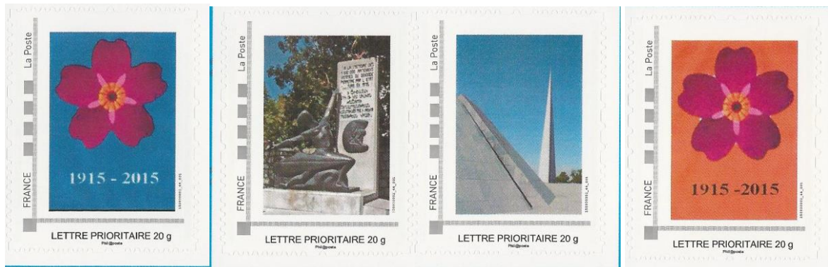
(Série indivisible des 4 Timbres 8€)